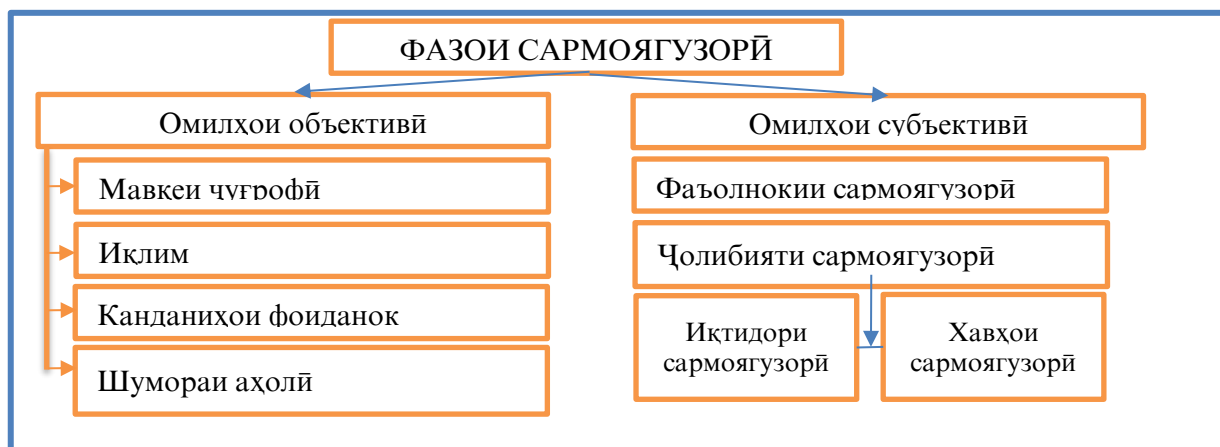
Расми 1.1. - Сохтори концептуалии мафҳуми фазои сармоягузорӣ

Бо назардошти таҳлили асосҳои концептуалии ташаккул ва инкишофи мафҳумҳои асосии муносибатҳои сармоягузорӣ сохтори зерини мафҳуми фазои сармоягузори пешниҳод намудан мумкин аст (расми 1.1).