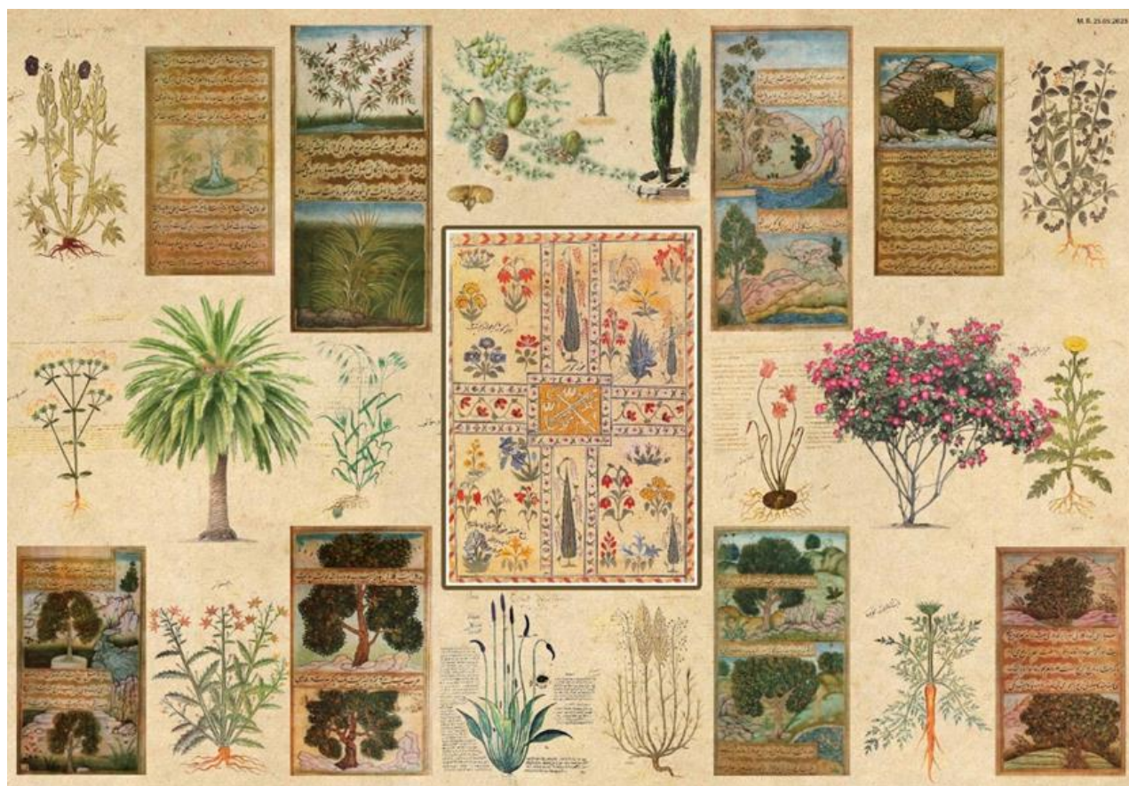
Расми 1. Коллаж аз растаниҳои истифодашаванда дар боғҳои таърихӣ “Чорбоғ” мувофиқи манбаҳои асримиёнагӣ

Дар ин қисмат аҳамияти анъанавӣ ва шаклҳои истифодаи навҳои буттаву дарахт, гулзори чаманҳо, ки аз сарчашмаҳои адабӣ, минҷураҳои асримиёнагӣ, ашъори шоирон, муаррихон, сайёҳатчиён, муҳаққиқони советиву муосир дар соҳаи боғсозӣ бармеоянд, мавриди назар қарор дода шудааст (Расми 1). Хусусиятҳо ва аҳамияти