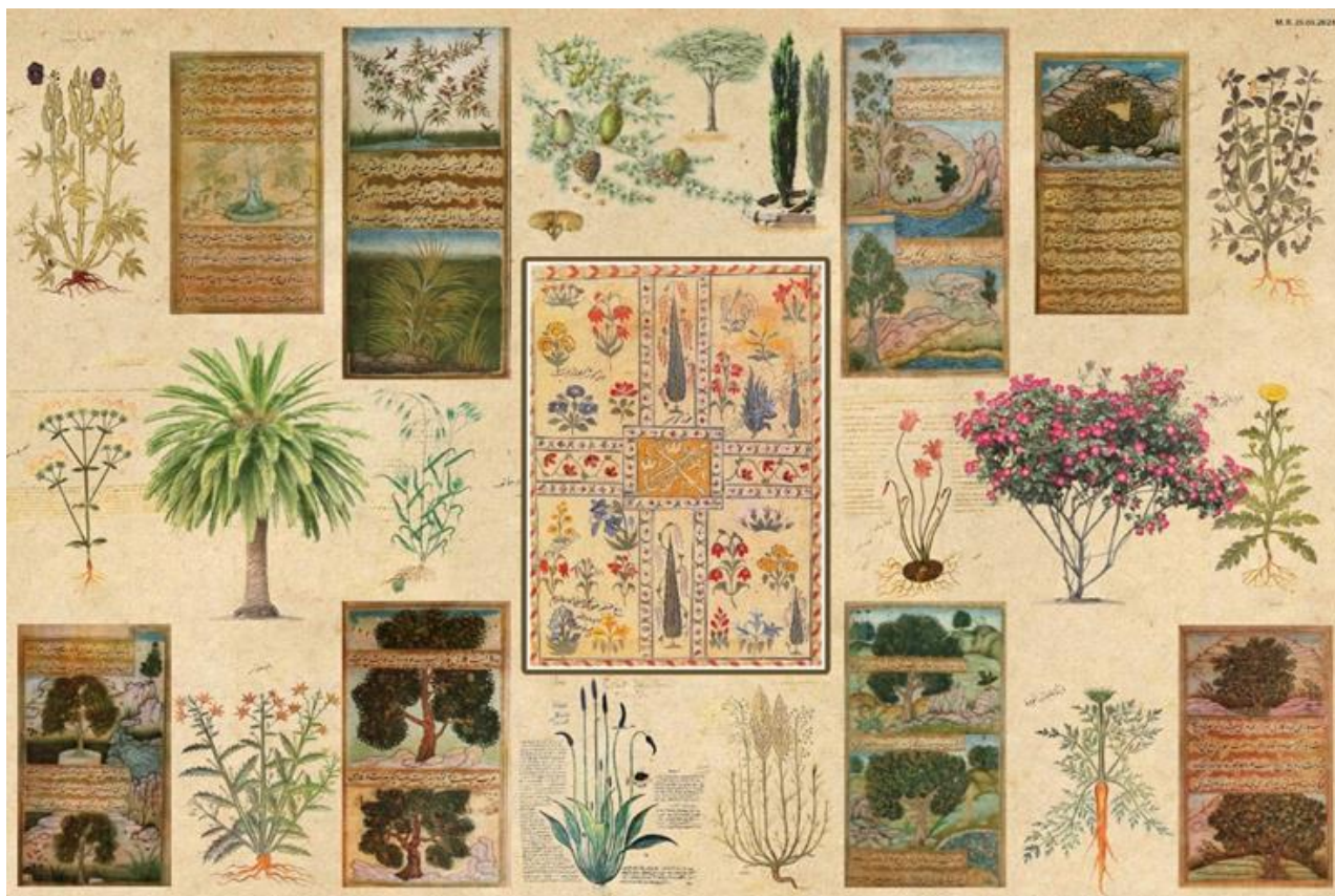
Рисунок 1. Коллаж растительностей, используемых в исторических садах «Чорбог»- согласно средневековым миниатюрам и трактатам

Коротко анализируются характерные особенности и значение некоторых видов растительности, которое создаёт декоративно - художественный, национально - традиционный облик садовых комплексов совместно с зеленым фоном, как форма спокойствия и созерцания (Рис.1). Основная роль зелени в саду, это создания тени –